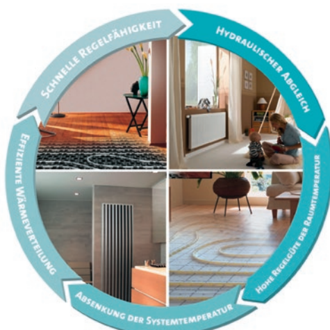
Bild 03: Systemgedanke der Wärmeübergabe (Flächenheizung/-kühlung und/oder Heizkörper).

Daher sollte für die eingebauten Komponenten eine gesamtheitliche objektspezifische System- und Ausführungsplanung, unter Berücksichtigung der produktspezifischen Kennwerte/technischen Daten, vorliegen. Diese Unterlagen sind als Bestandteil der Anlagendokumentation dem Nutzer/Auftraggeber auszuhändigen und im Rahmen der Übergabe zu erläutern (Einweisung!). Dadurch lässt sich für den Auftraggeber nachvollziehen, ob die in der Planung berücksichtigten Systeme/Bauteile auch eingebaut wurden.